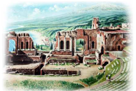
Taormina (Sizilien) - Teatro greco